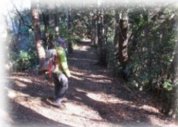
スタジイの樹林帯