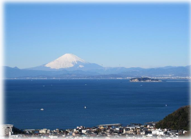
仙元山より相模湾